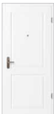
Öffnungsseite: Formgepresste Deckplatte Siba Plus 2F, Weiß lackiert WL10 (nach RAL 9010)

Unsere einbruchhemmenden Türen vereinen Design und Funktion. Sie sind in den verschiedensten Oberflächen und Modellen erhältlich und können sich so harmonisch in das Raumkonzept Ihrer Wohnung einfügen oder als Raumgestalter elegante Akzente setzen. Bei der Schließ- und Öffnungsseite Ihrer Tür müssen Sie sich nicht für eine Oberfläche entscheiden – Sie können auch zwei verschiedene Dekore auswählen.