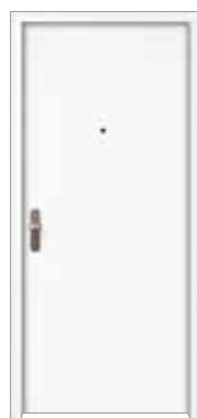
Schließseite: Glatt, Weiß lackiert WL10 (nach RAL 9010)

Erfahren Sie mehr zur Initiative und unseren Türen unter: https://www.jeld-wen.de/gewusst-wie/einbruchschutz/ oder in unserer Broschüre Sicherheit- und Einbruchschutz .